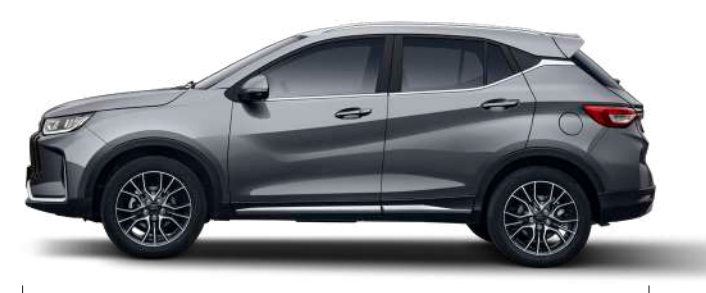
Wheel base: 2,601 length: 4,397